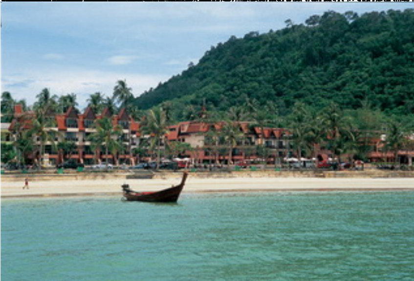
309 https://www.seaviewpatong.com/ Расположено от аэропорта г. Пхукет в южной части Патонг-бич (Patong Beach) в 10 минутах ходьбы