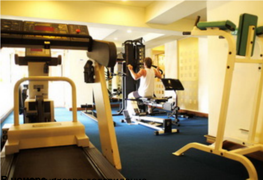
В номере есть телевизор (видение и звук), мини-бар (чай и кофе, сок, вода, алкоголь), Wi-Fi