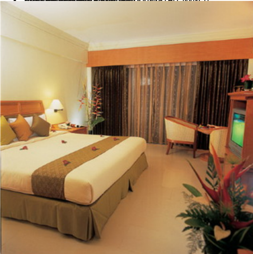
Номер оборудован кондиционером, сейфом, телевизором, Wi-Fi, мини-баром (чай, кофе, сок, вода, алкоголь), туалетом, ванной комнатой, феном, холодильником, телевизором (видение и звук), мини-баром (чай и кофе, сок, вода, алкоголь), Wi-Fi